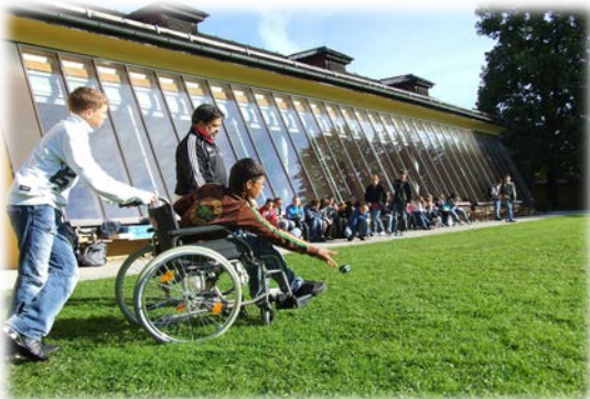
Instellingen, en onderwijs- en huisvestingsdiensten