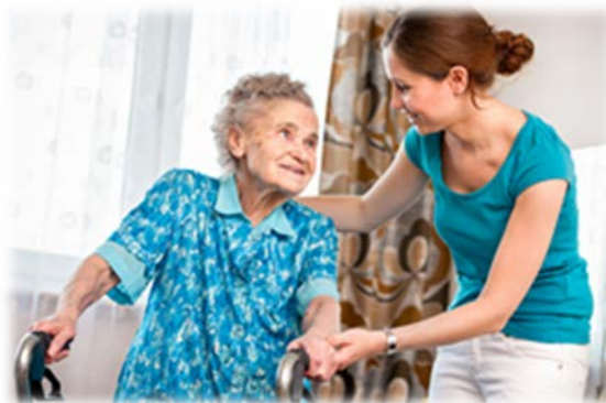
Thuishulp en -zorg