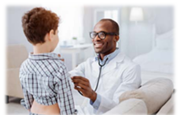
Ziekenhuizen en gezondheidsdiensten