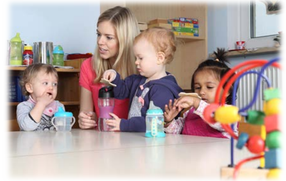
Sociale bijstand en gezondheidszorg