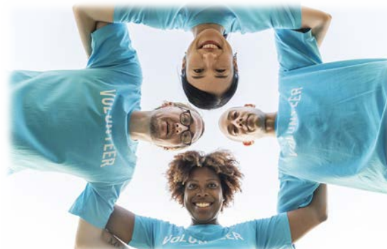
Sociale werking organisaties (social profit)